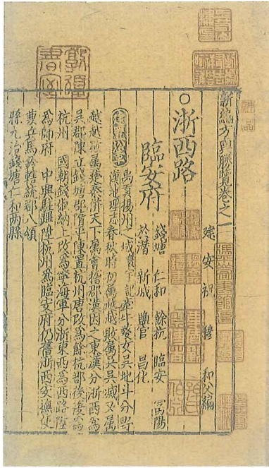
方輿勝覽七十卷 (宋) 祝穆編 宋咸淳三年 (1267) 刊本 Scenic historical places revisited by Zhu Mu. A 13th century imprint.