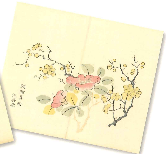
十竹齋書畫譜 (明) 胡正言摹 清光緒五年 (1879) 多色套印本 A copybook of drawings and calligraphy from the Ten Bamboos Studio by Hu Zhengyan. A late 19th century multi-coloured imprint.